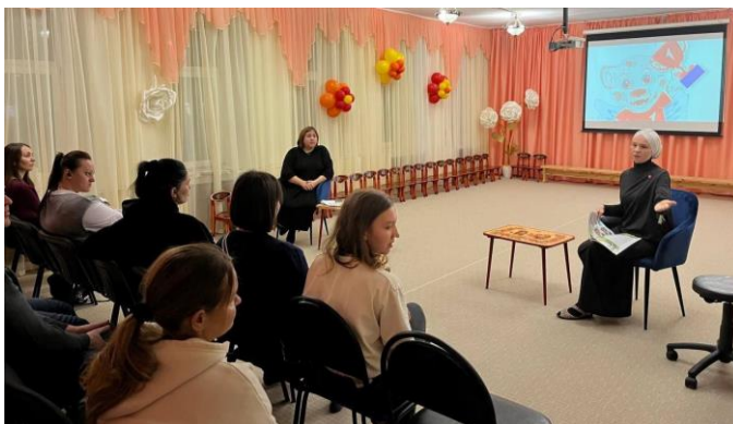
Родительское собрание, посвященное «Движению первых». Инструктаж по работе с дневничком «Путешествие начинается»

Ежегодно проводится совместная с родителями утренняя зарядка. Это помогает привлечь семьи к занятиям физкультурой, а также дисциплинирует: родители стараются приводить детей пораньше, чтобы успеть на утреннюю зарядку.