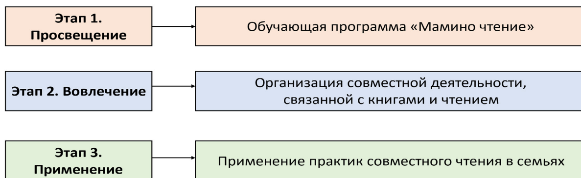
Рисунок 2 – Этапы реализации плана

На этапе практической реализации технологии проводится деятельность с книгами и на основе книг – мероприятия, нацеленные на просвещение родительского сообщества, вовлечение семей в коллективную деятельность и организацию чтения в семьях (рисунок 2).