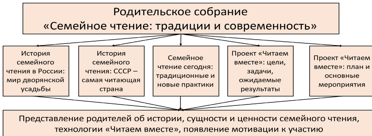
Рисунок 1 – Модель родительского собрания «Семейное чтение: традиции и современность»

Основными задачами проведения родительского собрания являются: