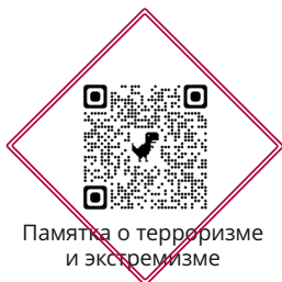
Памятка о терроризме и экстремизме