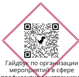
Гайдбук по организации мероприятий в сфере профилактики экстремизма и терроризма в молодежной среде

ГОСУДАРСТВЕННАЯ ПРОГРАММА «ОБЕСПЕЧЕНИЕ ОБЩЕСТВЕННОГО ПОРЯДКА И ПРОТИВОДЕЙСТВИЯ ПРЕСТУПНОСТИ В РЕСПУБЛИКЕ ТАТАРСТАН НА 2014-2025 ГОДЫ»