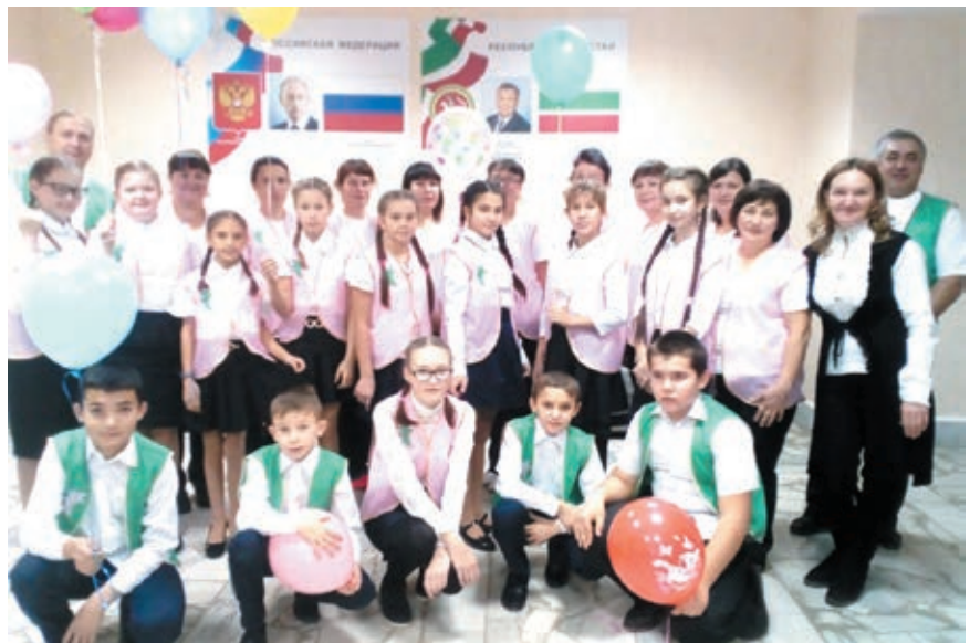
«Иң тату сыйныф» эти-эниләр комитетлары конкурсында

районы администрация башлыгы дипломы һәм кыйммәтле бүләгә беләндә билгеләнеп үтте. Шулай ук мәктәпнең ата – аналар белән эш тәҗрибәсе районкүләм укытучылар һәм тәрбия эшләре буенча директор урынбасарлары эчен үткәрелгән семинарда күтсәтелде. Монда да гаиләләр белән берлектә шәжәрәләр һәм «Гаилә портреты» «күргәзмәләре зур кызыксыну уятты. Бик кызыклы факт та ачыкланды монда, күп кенә гаиләләрдә бергә тешкән портретта юк икән әле, минем бу хезмәтне укучыларга да бу сорауны бирәсем килә: «Ә сезнең гаилә портретыгыз бармы соң!?»