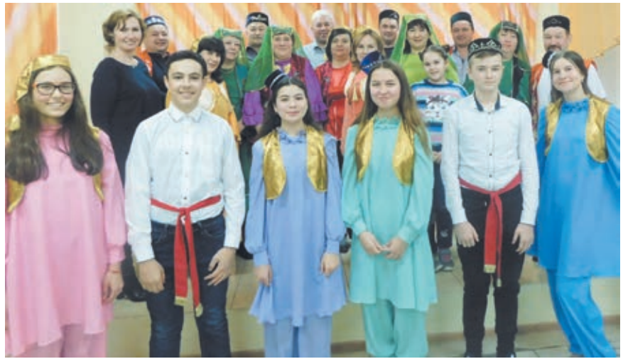
Эти-эниләр белән берлектә гаилә бәйрәмнәре