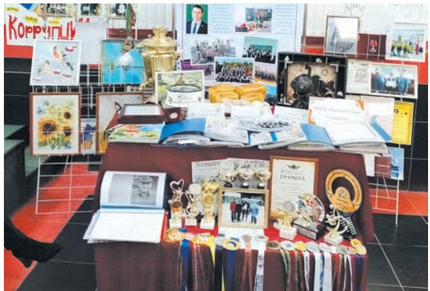
Выставка дружного 7 Б класса

демонстрировал, насколько важно вовлечение родителей в школьную жизнь не только с точки зрения учебного процесса, но и в рамках воспитания.