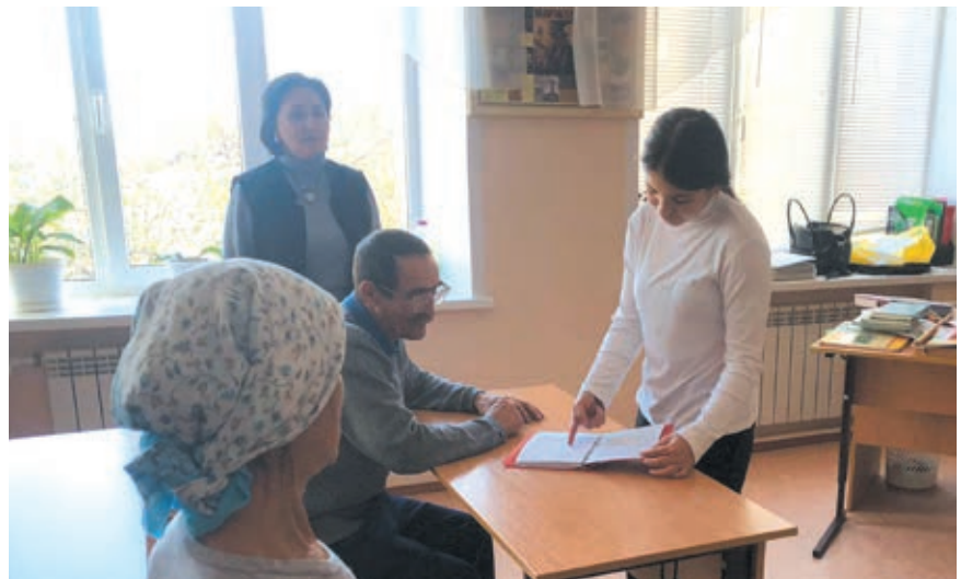
Папа – главный пример!