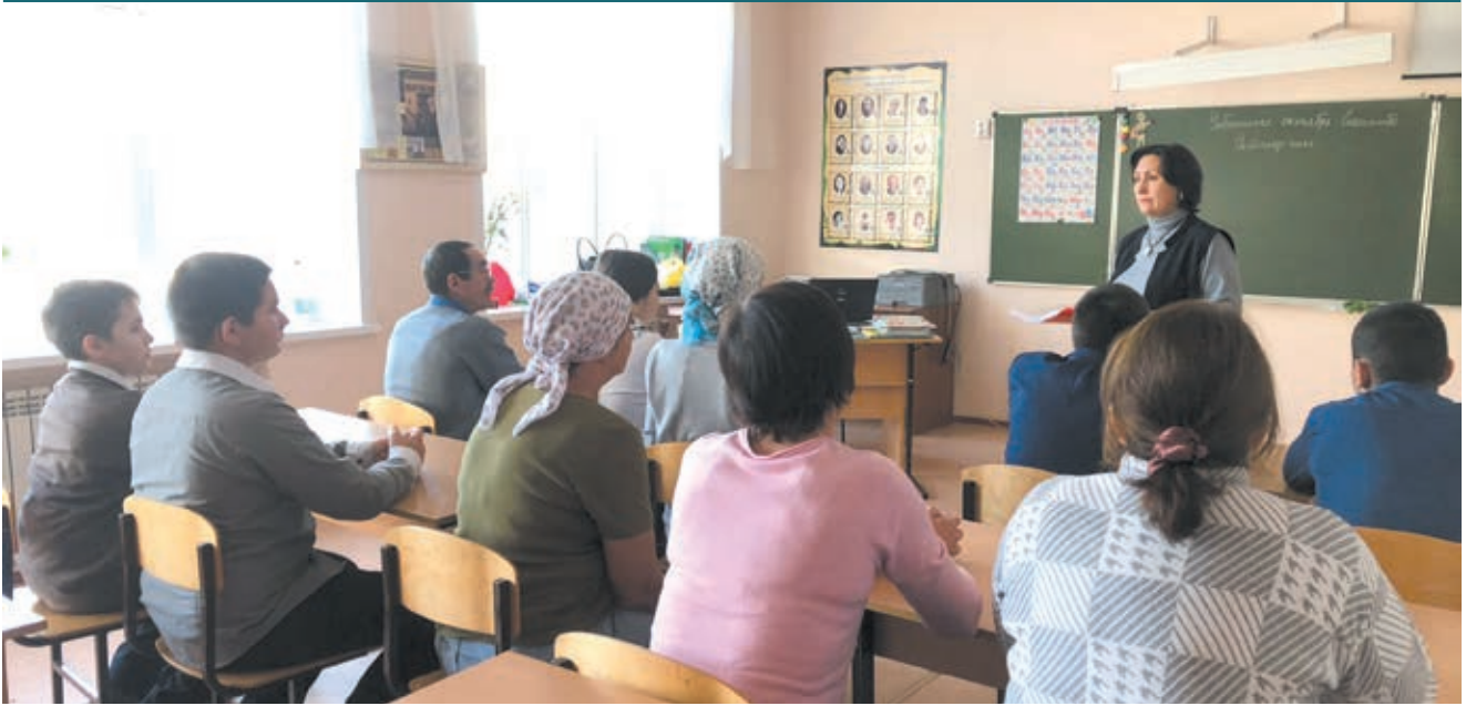
Ваше поведение – пример для вашего ребенка

но не только проговаривать свои желания и претензии, но и уметь не просто слушать собеседника, а слышать, что он хочет донести.