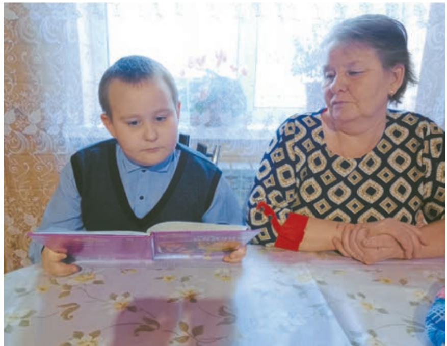
Рис. 1. Семейное мероприятие «Как хорошо читать, когда тебя слушают»

Таким образом, сотрудничество школы и родителей имеет множество позитивных моментов для ребенка. Дети, чьи родители активно участвуют в образовательном процессе, чаще демонстрируют лучшие результаты в учебе, имеют более высокую са-