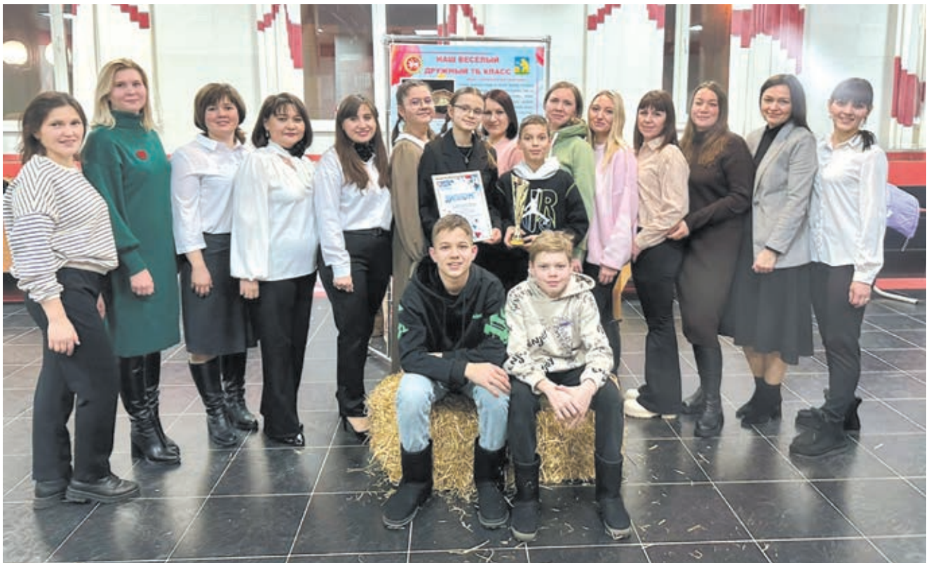
Конкурс «Секреты дружного класса»

ми, делая процесс совместной работы еще более слаженным.