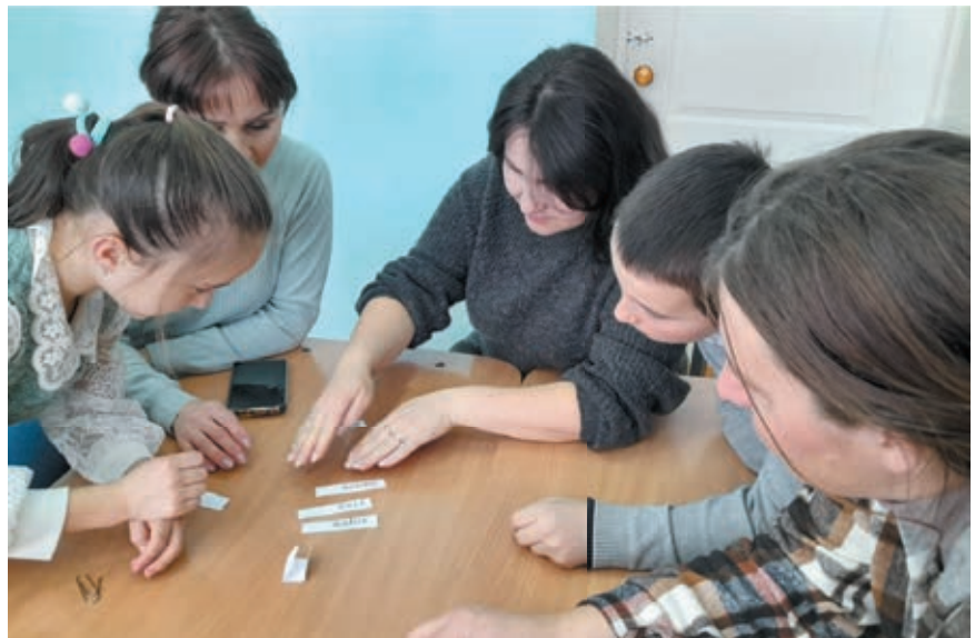
Рис. 2. Семейное мероприятие «Как хорошо, когда мы вместе»

моценку и уверенность в себе. Кроме того, такие дети чувствуют себя поддержанными и любимыми, что способствует их психологическому благополучию. В итоге, сотрудничество школы и родителей – это важный фактор успеха ребенка. Обе стороны должны стремиться к плодотворному взаимодействию, основанному на доверии, уважении и понимании. И как тут не вспомнить слова великого педагога В.А. Сухомлинского: «Только вместе с роди-