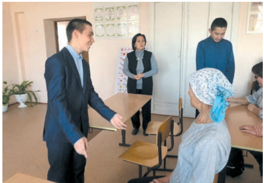
Важно выслушать ребенка

Мама, папа, помните! Вы самые близкие, дорогие и незаменимые люди в жизни вашего ребёнка. И только ваш ежедневный пример может сформировать полноценного члена общества, а школа всегда будет главным помощником в формировании личности ребёнка.